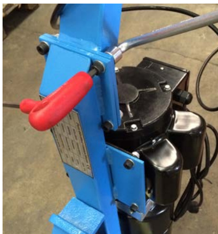
Visé la bras de la central