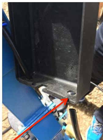
Mettre la durite noir dans le trou