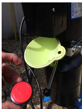
Mettre les 5 litres d'huile dans le réservoir