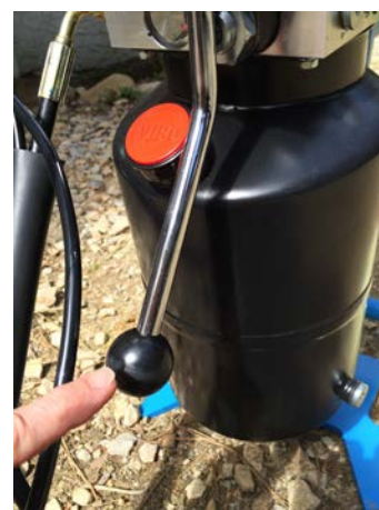
Lavier de descente du pont