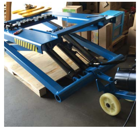
Pour descendre le pont de la palette