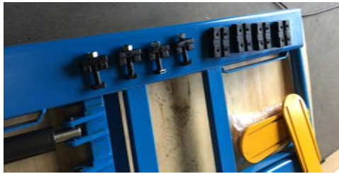
4 Bras , 4 écroues et 4 Tampons