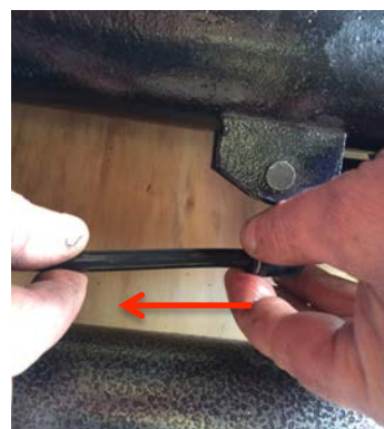
Branché la durite et pour débrancher la durite appuyer sur la petite rondelle