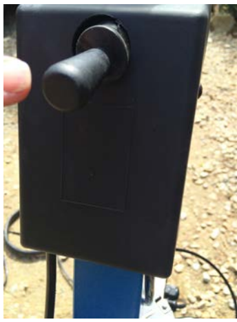
Déverrouillage de la Crémaillère