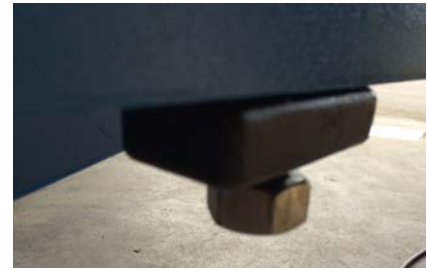
Positionner les 4 bras et faite une réglage horizontal