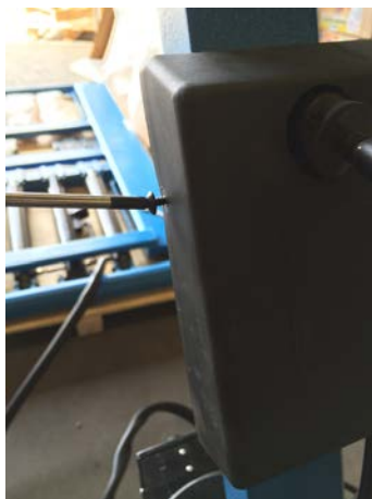
Devisé les 2 vis