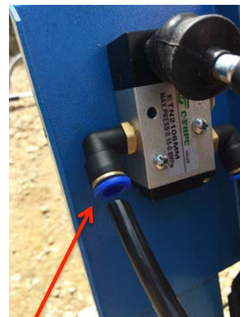
Branché la durite en poussant dessus