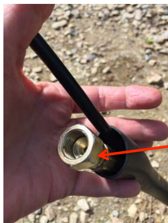
Branché le tuyau sur le pont avec une clé plate de 19