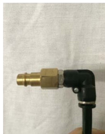
Branchement a votre compresseur