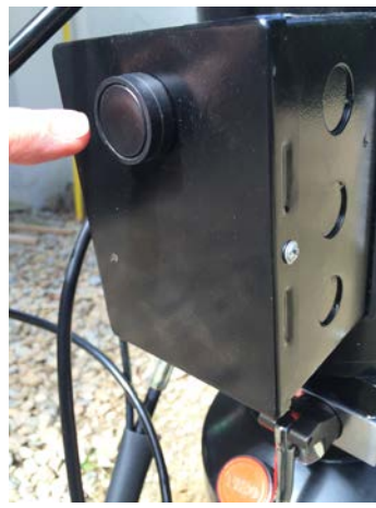
Bouton pour la montée du pont